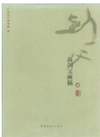
《高剑父画稿》责任编辑 叶耀才 2007年 岭南美术出版社 大 16 开 全彩精装 定价: 200 元